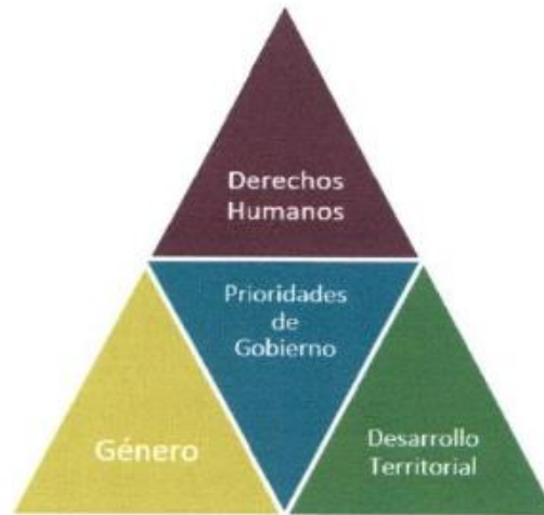
Ilustración 7: Prioridades de Gobierno - Fuente: Exposición de Motivos 2025 - SEFIN