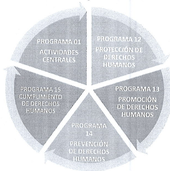
Estructura Programática 2025

Actividades Centrales 01 , constituido por la Dirección Superior y unidades de apoyo que asisten a los programas responsables de la producción institucional.