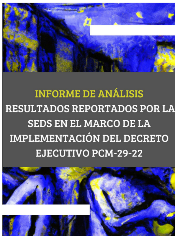
Portada del Informe de Análisis

3. Las autoridades estatales se encuentran en la obligación de justificar suficientemente las razones por las que se tomó la decisión de ampliar la medida del Estado de Excepción