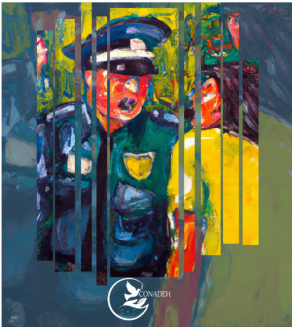
Portada del Informe Desafíos Invisibilizados

Desafíos invisibilizados: violencia de género durante el Estado de Excepción