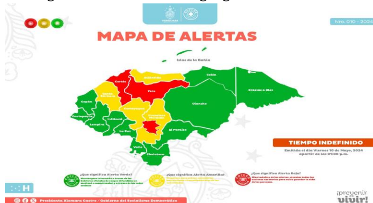
Imagen No.4: Distribución geográfica del nivel de alerta