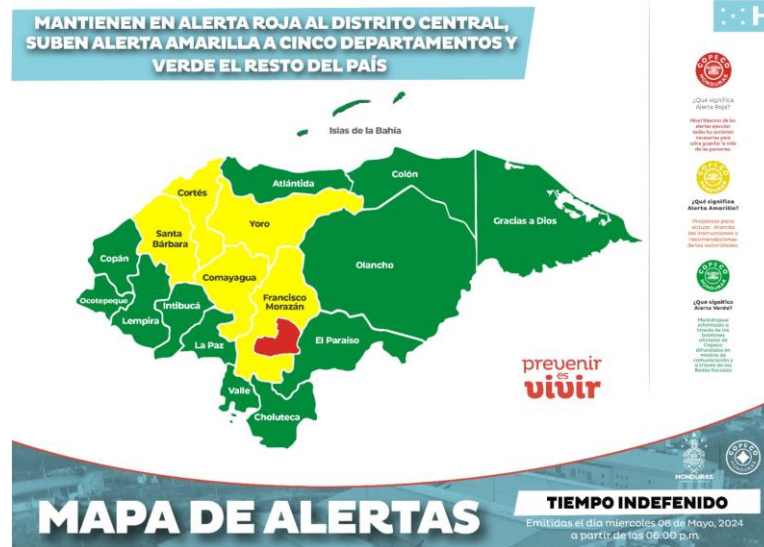
Imagen No.3: Distribución geográfica del nivel de alerta