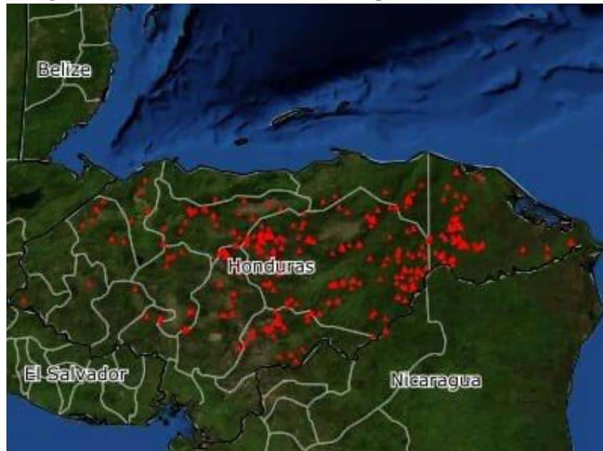
Imagen No. 8: distribución de los 487 puntos de calor