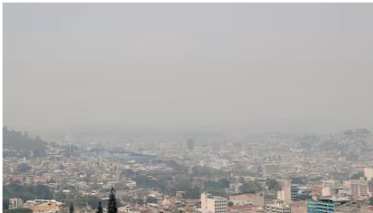
Imagen No.1: Vista de Tegucigalpa frente al alto índice de contaminación del aire.