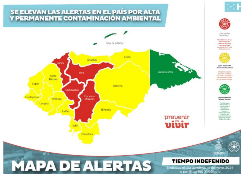
Imagen No.5: Distribución geográfica del nivel de alerta