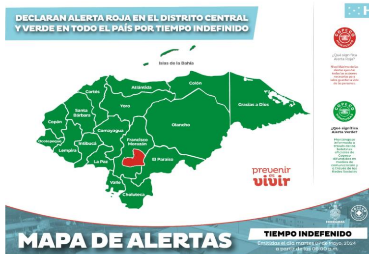
Imagen No.2: Distribución geográfica del nivel de alerta